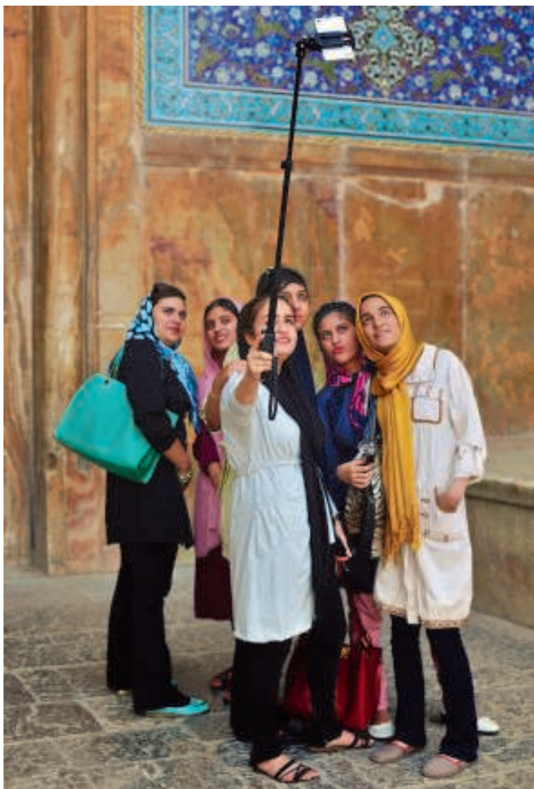
Nationale sport in Iran: selfies nemen.

Dat zou wel eens kunnen gebeuren. In april dit jaar werd een historische overeenkomst afgesloten tussen Iran en de zes wereldmachten: