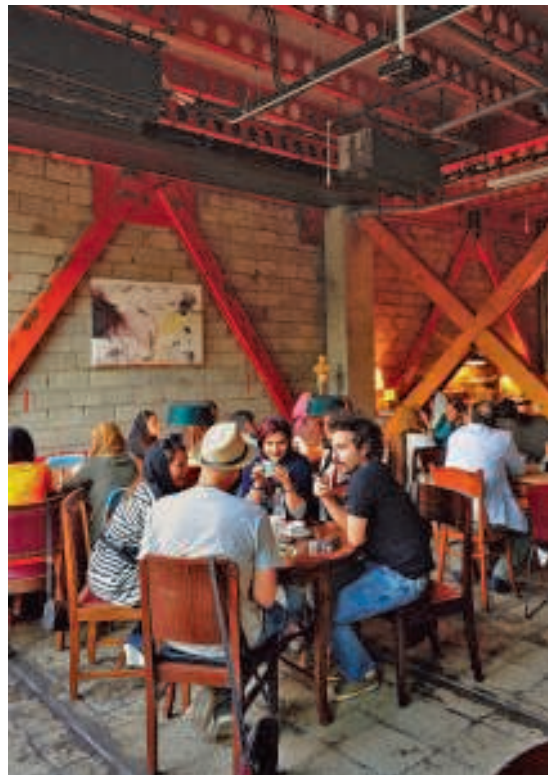
Aan hippe cafés en restaurantjes geen gebrek. Alcohol is er evenwel uit den boze.