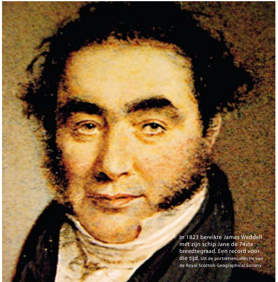
In 1823 bereikte James Weddell met zijn schip Jane de 74ste breedtegraad. Een record voor die tijd. Uit de portrettencollectie van de Royal Scottish Geographical Society