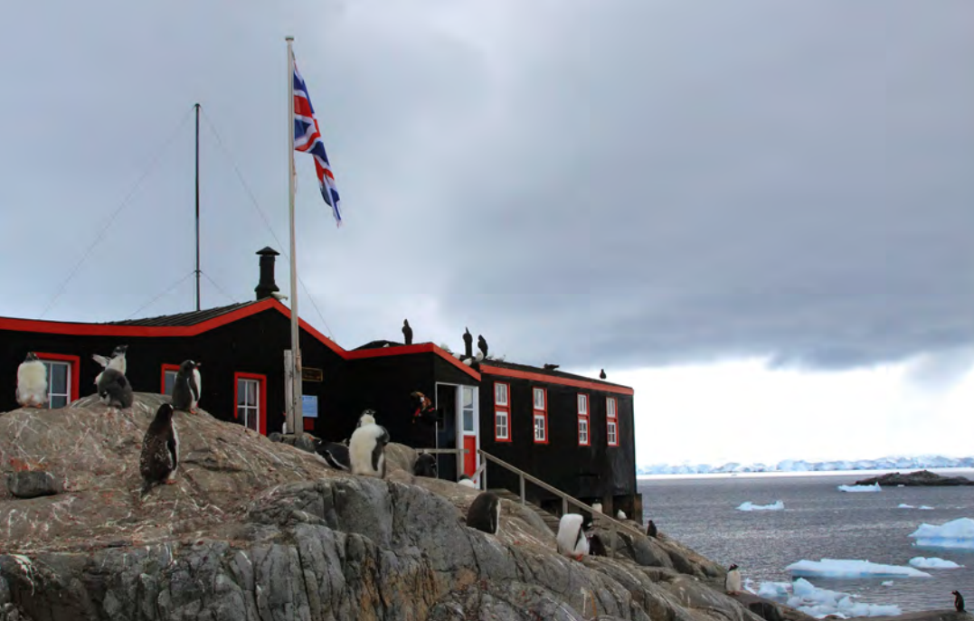
Port Lockroy wordt vier maanden per jaar bemand. Daarna hebben de pinguïns vrij spel.