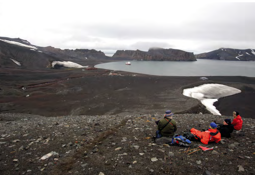
Whalers Bay op Deception Eiland. In werkelijkheid is het eiland een verzonken vulkaankrater.

Jean Charcot met zijn French Antarctic Expedition (1903-1905) de beschutte plek. Toen stond er nog geen knalrode brievenbus zoals vandaag. Men zette bakens uit waarin boodschappen werden achtergelaten. Met wat geluk werden die opgepikt door toevallige passanten, zoals walvisvaarders. Charcot gaf de natuurlijke haven de naam Lockroy naar een van zijn sponsors, de Franse politicus Etienne-Auguste-Edouard Lockroy. Goudier Eiland zelf kreeg de naam van de hoofdmachinist van het schip.