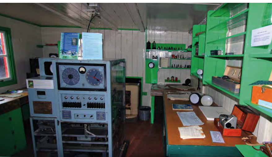
De basis heeft een gerestaureerd meteorologisch lab anno jaren 1950.