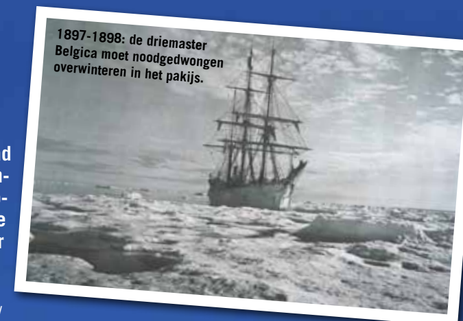
1897-1898: de driemaster Belgica moet noodgedwongen overwinteren in het pakijz.

Zou België ooit belangstelling gehad hebben voor Antarctica zonder baron-avonturier Adrien de Gerlache de Gomery? Hij was de man die de eerste wetenschappelijke expeditie naar Antarctica op touw zette.